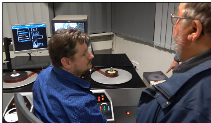
Exkurze ve filmových studiích – ukázka stroje na barevné korekce filmu

Vlastní festival začal hned v pátek dopoledne promítáním pro školy. Večer se pak už promítalo pro turisty. Obě promítání pak doprovodila beseda