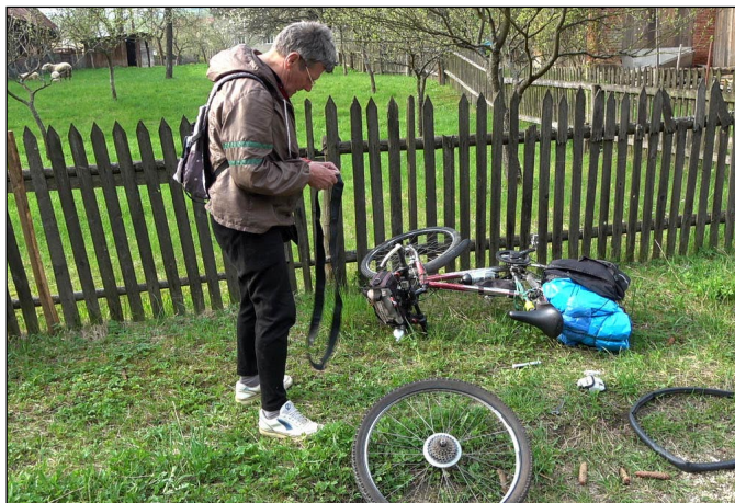
Druhá oprava zadního kola během dne. Obešla se bez naprostého zájmu oveček, které daly přednost pastvě a skotačení v zahradě

Vsetín – jedno z valašských center a město, které dalo této řece přízvisko. Stoupání kolem vody je téměř neznatelné, jen kopce kolem nás dávají