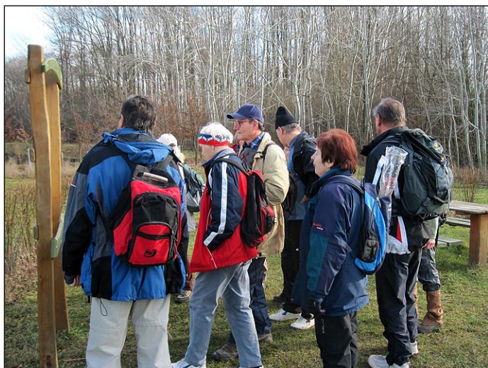
Vycházka brněnské chasy po naučné stezce.