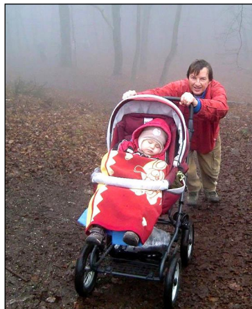
Z novoročního výstupu na Babí lom.